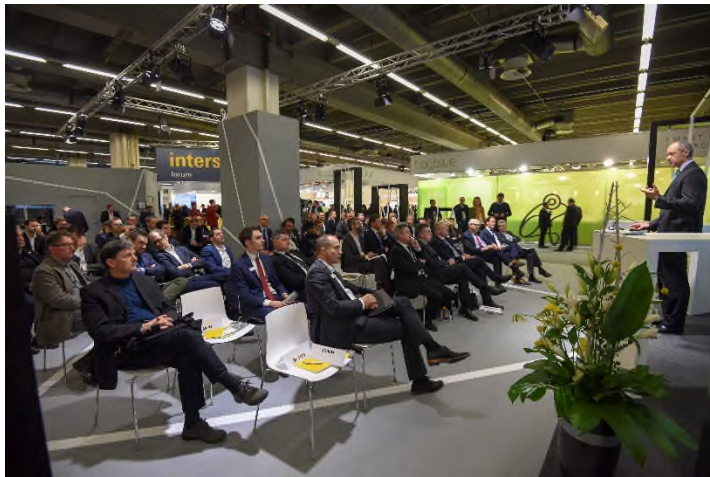
Das Intersec Forum: vom 14. bis 18. März 2022 die zentrale Informationschnittstelle der Intersec Building, dem Angebotsbereich für vernetzte Sicherheitstechnik zur Light + Building.

Live und mit sicherem Veranstaltungskonzept findet das fünfte Intersec Forum, Konferenz für vernetzte Sicherheitstechnik, 2022 statt: Es beginnt am zweiten Messetag der Light + Building und begleitet die internationale Leitmesse für Licht und Gebäudetechnik in deren Angebotsbereich Intersec Building – mit Konferenzwissen und Expertenaustausch zu allen Aspekten der vernetzten Technologien für die Sicherheit von und in Gebäuden.